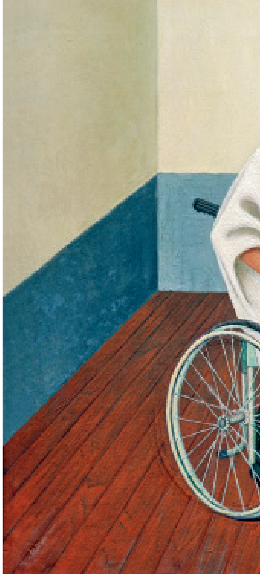
Autorretrato con el retrato del doctor Farill 1951, óleo sobre masonita, 41,5 × 50 cm Colección privada (detalle)