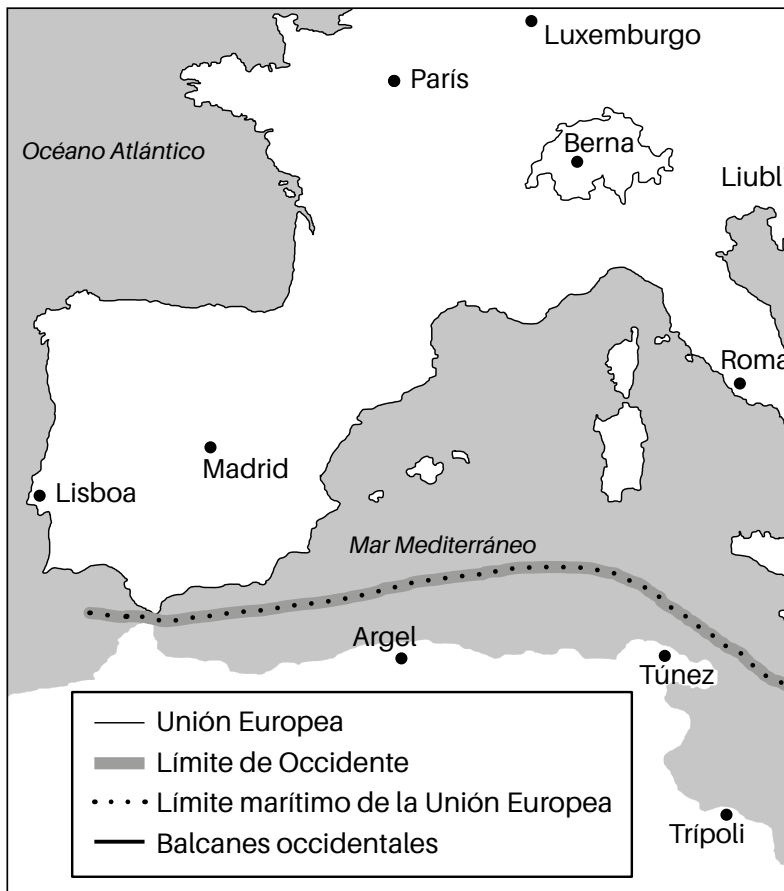
Mapa 1. La Europa entre el Sur y el Norte.