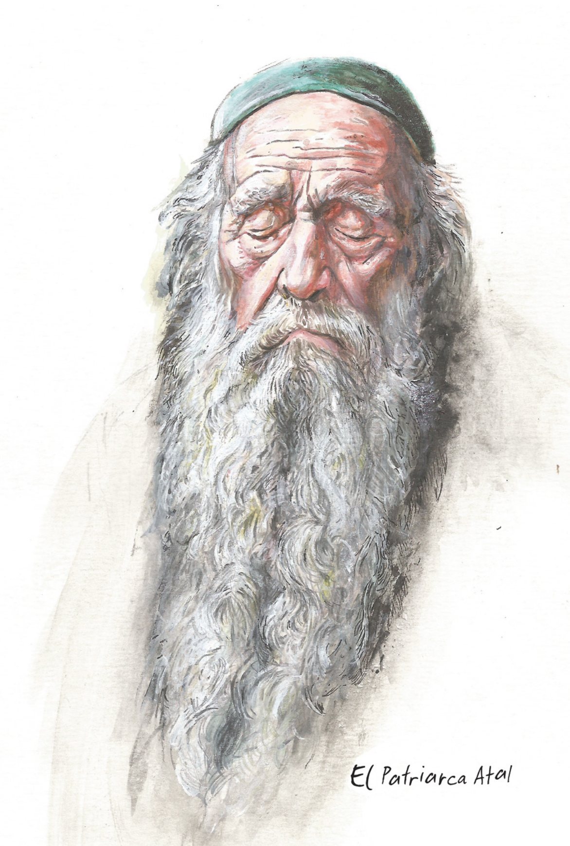
El Patriarca Atal