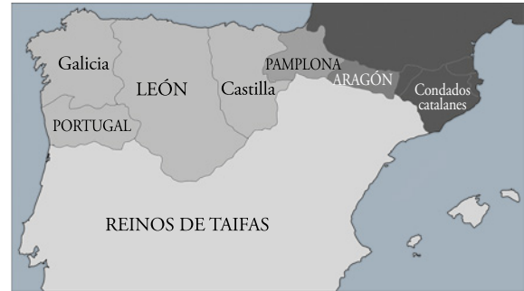
La península ibérica alrededor de los años 1050.

cinco pisos rematados por una galería. El interior muestra los tradicionales arcos doblados sobre pilares cruciformes, arcos fajones y bóveda de cañón.