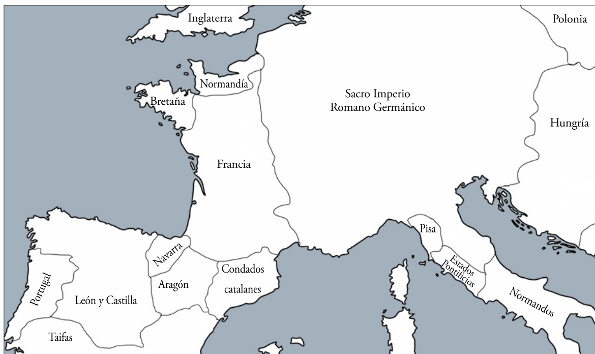
El mundo románico alrededor del año 1150.

A medida que se vayan asentando las peregrinaciones, se repetirá un modelo de iglesia, precisamente denominado «iglesia de peregrinación», caracterizada por dos elementos propios: la tribuna y la girola o deambulatorio. No obstante, hay templos en plenas rutas que no cuentan con alguno de estos dos elementos y, al mismo tiempo, sí pueden aparecer en iglesias muy alejadas de las principales vías de peregrinación.