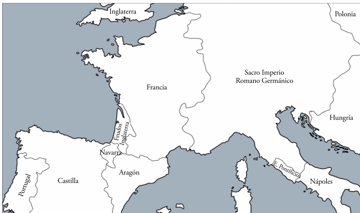
El mundo románico alrededor del año 1250.

niacense. La gran nave central está presidida por unos imponentes pilares estriados que sirven como apoyo a los arcos fajones y que delimitan los arcos ojivales a través de los cuales se accede a la nave lateral. La ausencia de deambulatorio y de transepto debe entenderse como un deseo de reforzar la continuidad espacial. El triforio muestra tres vanos, de los cuales únicamente el central no es ciego.