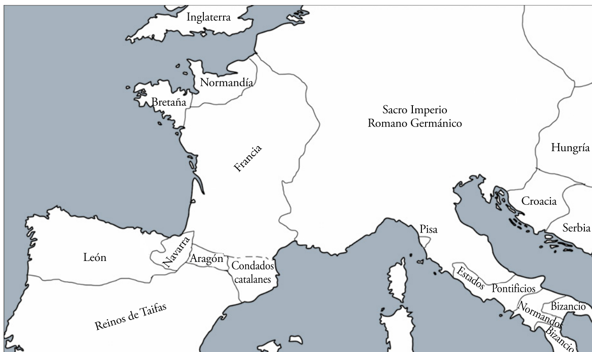
El mundo románico alrededor del año 1050.

piedra, y entonces la bóveda de cañón será la más empleada. La estructura la completarán los arcos fajones, los dispuestos transversalmente al eje de la nave, y los formeros, paralelos al eje central. Este tipo de cascarón se extiende preferentemente a lo largo de la nave central. Por su parte, tanto en las naves laterales como en las tribunas se opta por una bóveda de arista, resultante del cruce o choque de dos bóvedas de cañón. Por último, ábsides y capillas suelen cubrirse con bóvedas de horno o de cuarto de esfera.