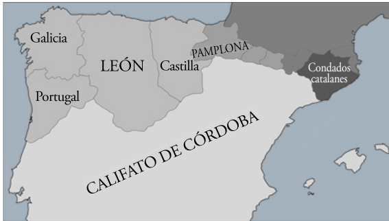
La península ibérica alrededor de los años 950.