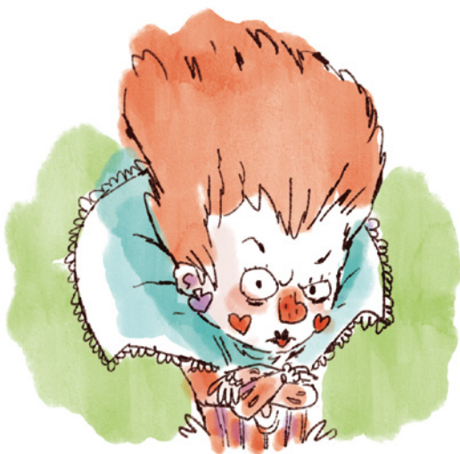
Reina de Corazones