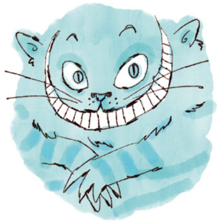
Gato de Cheshire