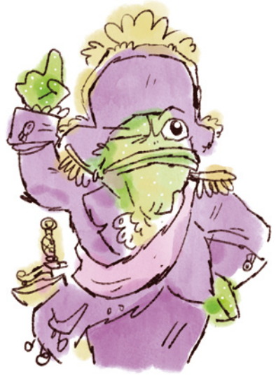
General Ho Chien