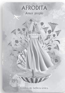
La medicina (presente)