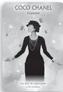
El resultado (futuro)

La primera carta te muestra qué te está poniendo entre las cuerdas o bloqueando actualmente. Si aparece, por ejemplo, Kali, puede significar que algunas creencias antiguas te están impidiendo continuar con tu camino espiritual. La segunda carta representa la medicina que necesitas ahora para resolver tu problema y crecer con él. Si aparece, por ejemplo, Afrodita, significa que necesitas amor propio y aceptación. Así pues, deberías dedicar conscientemente tiempo a tus necesidades. Sé paciente contigo misma. Integrar la medicina en tu vida requiere de todo un proceso. La tercera carta muestra el resultado que obtienes si sigues el camino de la carta medicina. Si aparece, por ejemplo, Coco Chanel, significa que lograrás encontrar tu expresión auténtica.